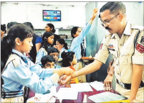
जवान को राखी बांधती छात्रा।