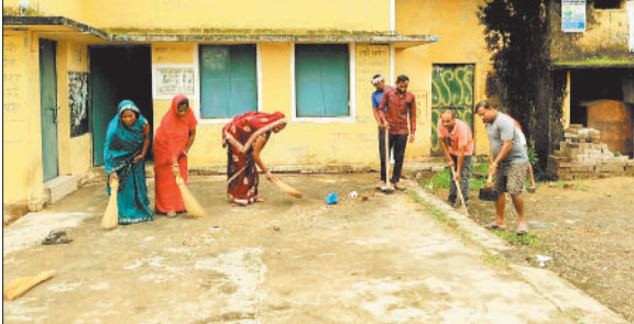
साफ-सफाई अभियान में जुटी स्वच्छता दीदी।