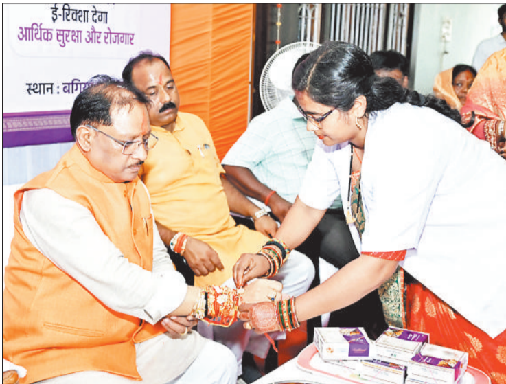
मुख्यमंत्री को राखी बांधती जशपुर की दीदी।

मुख्यमंत्री विष्णु देव साय के गृह ग्राम बगिया कैम्प कार्यालय में रक्षाबंधन के पावन पर्व पर विभिन्न योजनाओं से लाभान्वित दीदीयों ने राखी बांधकर आभार व्यक्त किया। मुख्यमंत्री को प्रधानमंत्री आवास योजना, महतारी वंदन योजना से लाभान्वित दीदीयां आंगनवाड़ी, कार्यकर्ता सहायिका, और मितानिन स्व सहायता समूह की दीदियों ने राखी बांधी मुख्यमंत्री ने सभी दीदियों को रक्षाबंधन की हार्दिक बधाई और शुभकामनाएं दी उन्होंने कहा कि रक्षा बंधन का पवित्र त्योहार भाई और बहनों की आपसी रिश्तों और प्रतीक का त्योहार है। उन्होंने कहा कि रक्षा बंधन त्योहार के पर्व पर भाई बहनों की रक्षा का संकल्प लेती है। मुख्यमंत्री ने कहा कि हमारी सरकार लोगों के विकास के लिए निरंतर कार्य कर रही है। छत्तीसगढ़ के लगभग तीन करोड़ की जनता का आशीर्वाद हमेशा